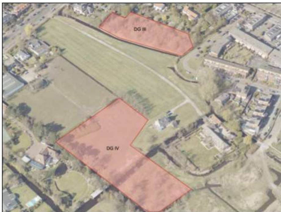
Figuur 2 - Projectlocatie ingezoomd met deelgebied III en IV.

Voordat er een definitieve vaststelling van het bestemmingsplan komt zal er nog een aantal onderzoeken moeten worden uitgevoerd. Een daarvan is een archeologisch onderzoek. Om dit archeologisch onderzoek te kunnen uitvoeren moeten er proefsleuven worden gegraven op de percelen van Niersman. Het betreft de hieronder aangegeven deelpercelen.