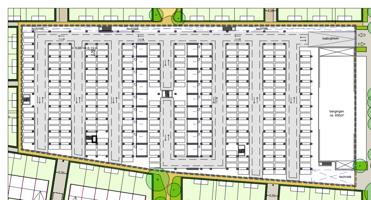
P1: Schematische inrichting Parkeerkelder met ca. 250 parkeerplaatsen